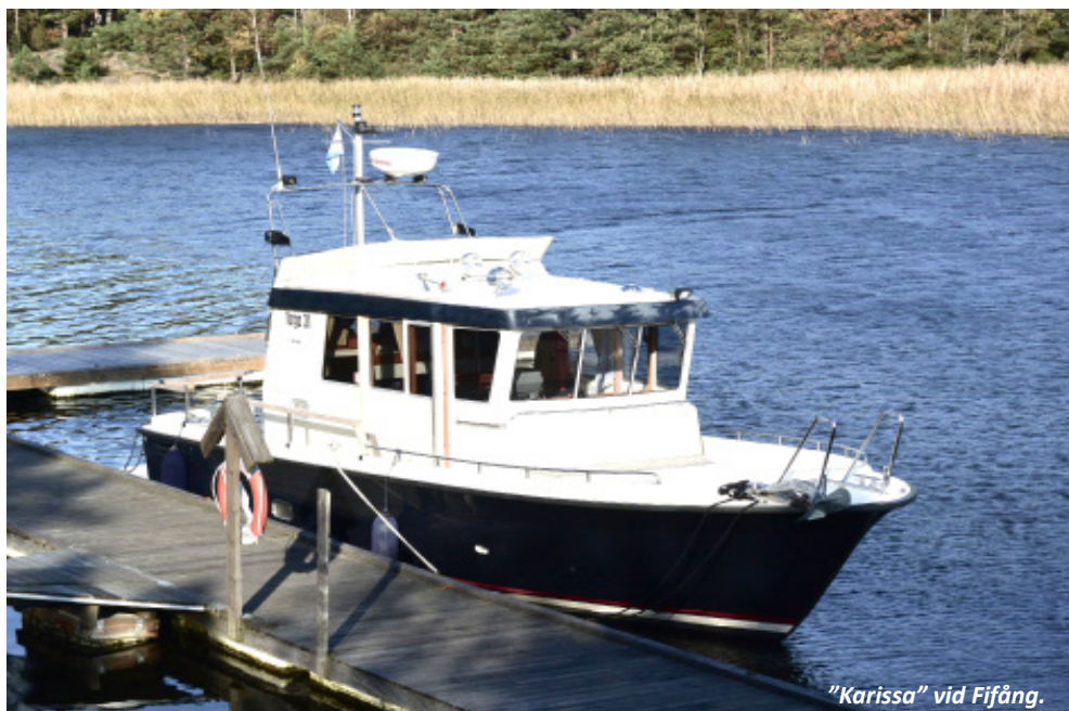
"Karissa" vid Fifång.