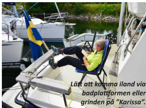
Lätt att komma iland via badplattformen eller grinden på "Karissa".

Numera åker vi inte så långt på grund av ålder och sjukdom men i somras gick vi upp till Söderhamn. De flesta turer numera går till olika klubbhamnar och helst till flytbryggor då vi vill ligga långsides för att lätt komma av och på. Vi har övernattnat i snitt 75 nätter per år med motorbåten.