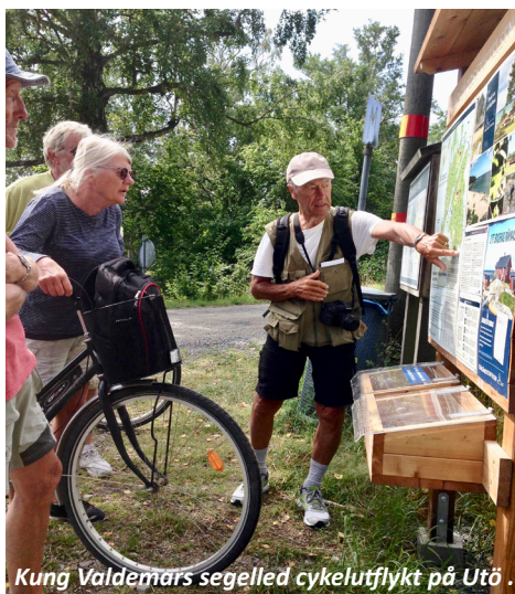
Kung Valdemars segelled cykelutflykt på Utö.