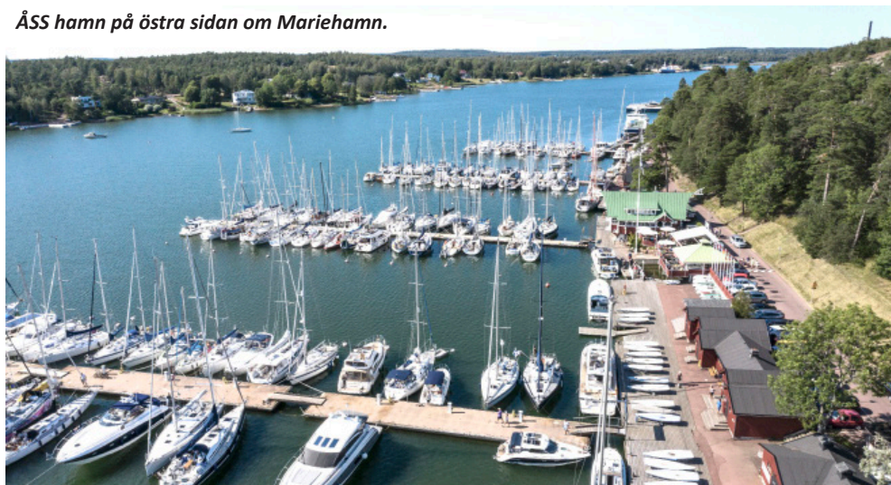
ÅSS hamn på östra sidan om Mariehamn.

På Åland finns stora möjligheter till bad och fina cykelutflykter.