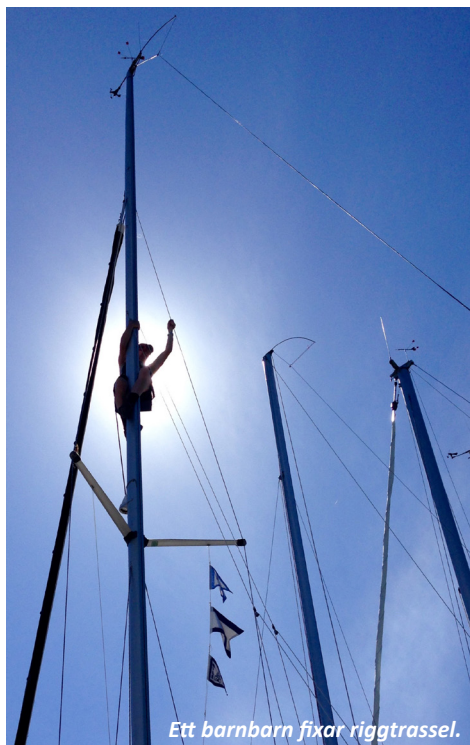
Ett barnbarn fixar riggtrassel.

Den som vill kan välja en alternativ natthamn. Man kan besöka bekanta, göra egna studiebe- sök, besöka läkare, välja gästhamn eller natur- hamn mm. Vi umgås när och om vi själva vill. Alla måste inte hänga med på allting. Det är fullt OK att ta det lugnt eller att göra en egen utflykt.