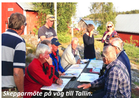
Skepparmöte på väg till Tallin.