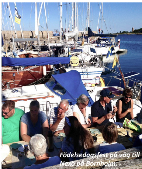
Födelsedagsfest på väg till Nexø på Bornholm.