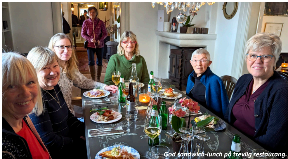
God sandwich-lunch på trevlig restaurang.

Den 4-5 maj träffas alla som vill ha möjlighet att träna praktiskt. Vi kommer att kunna