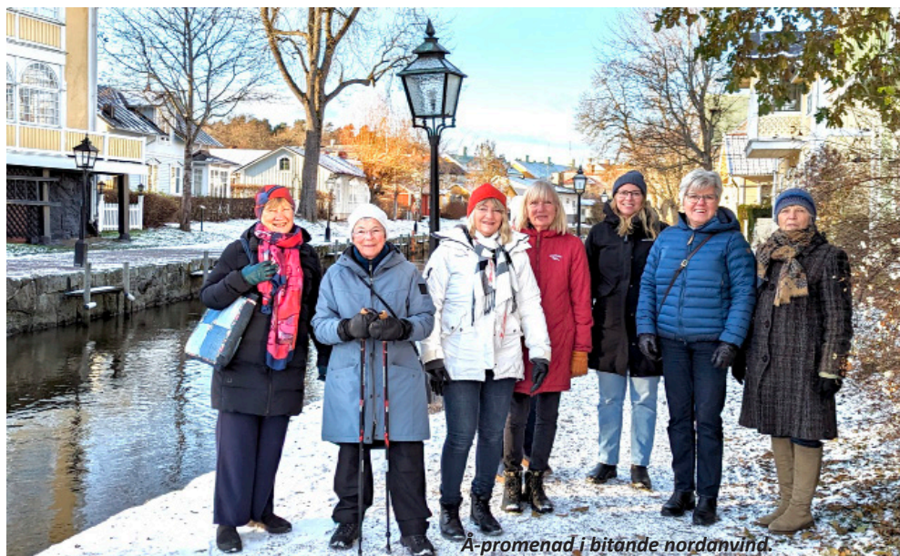
Å-promenad i bitande nordanvind.